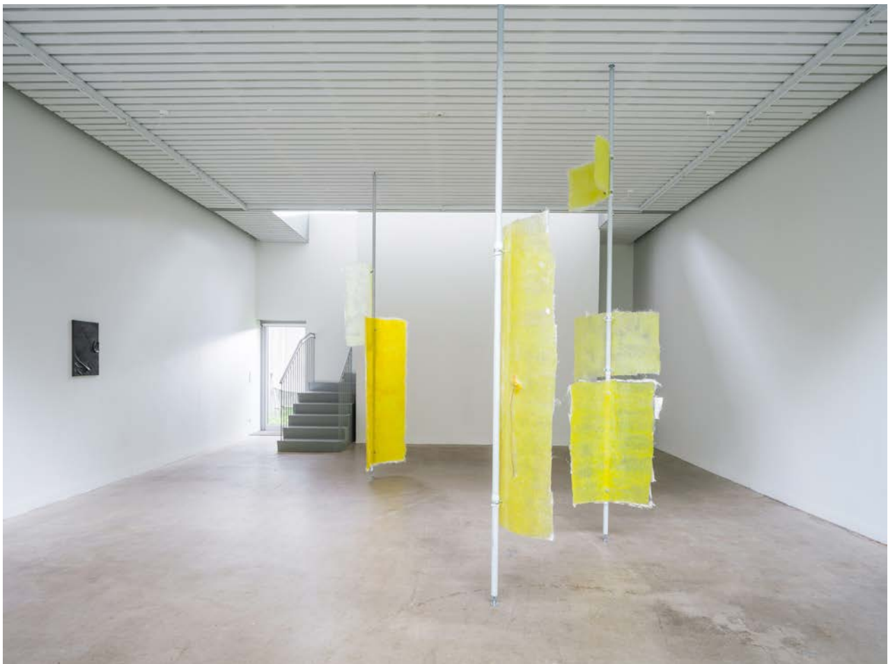
Installation view - Valmue Valentino , 2021, duo show with Cecilie Skov, Four Boxes - Skive, DK. Curated by Mai Dengsøe