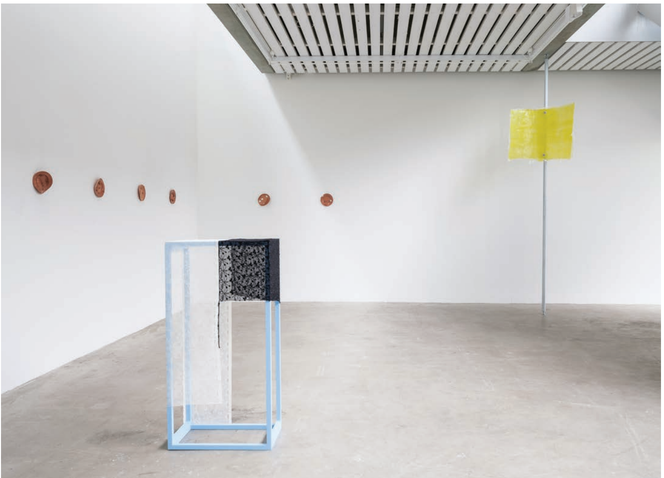
Installation view - Valmue Valentino , 2021, duo show with Cecilie Skov, Four Boxes - Skive, DK. Duo show curated by Mai Dengsøe, Four Boxes - Skive, DK.