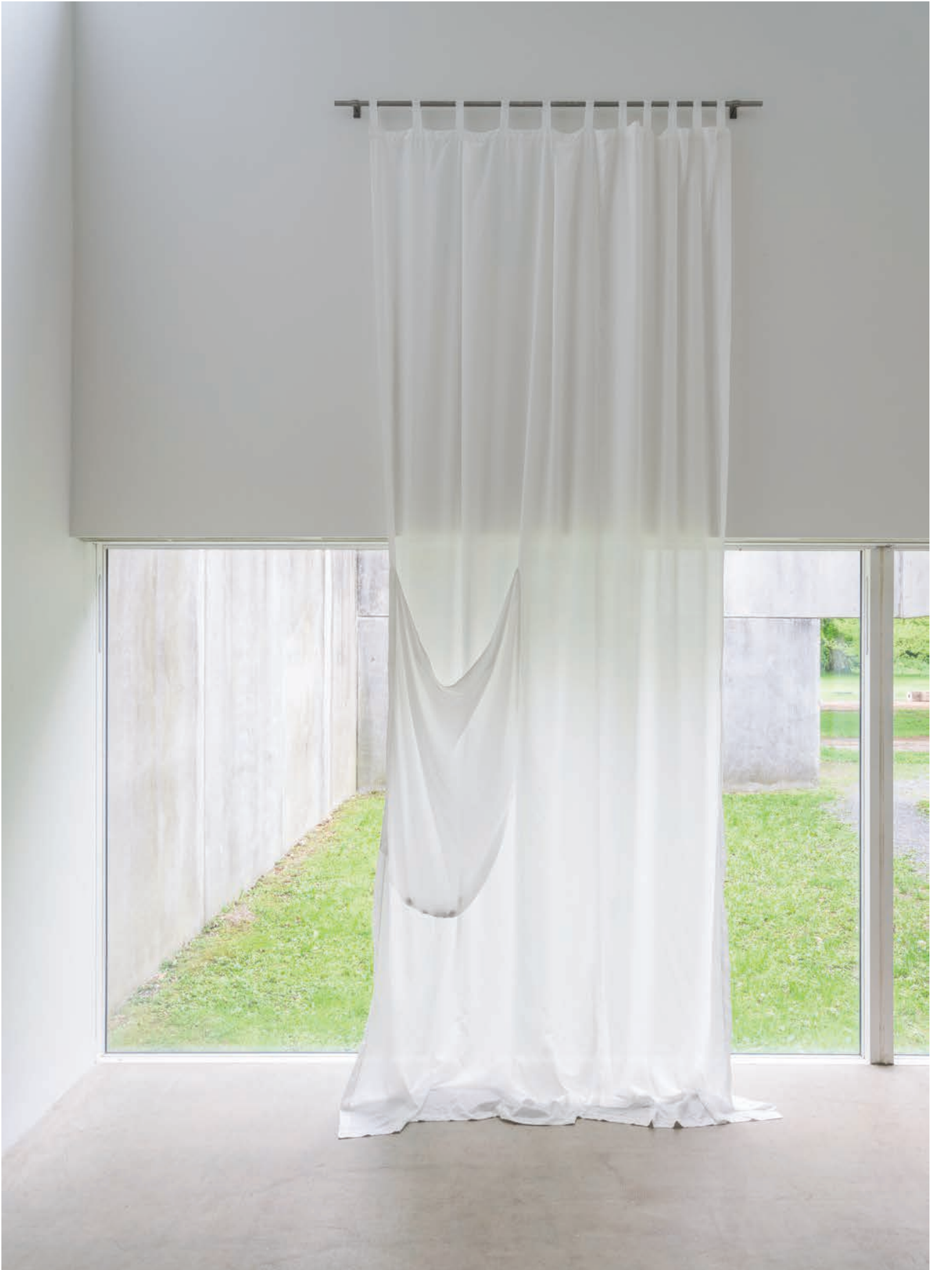
Five stone game , Aia Sofia Coverley Turan, Textile, steel, 5 stones, 2021, 450 x 245 cm. Duo show curated by Mai Densøe, Four Boxes - Skive, DK.