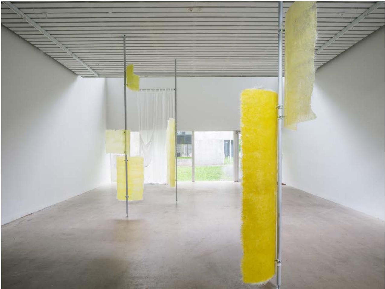
Installation view - Valmue Valentino , 2021, duo show with Cecilie Skov, Four Boxes - Skive, DK. Curated by Mai Dengsøe