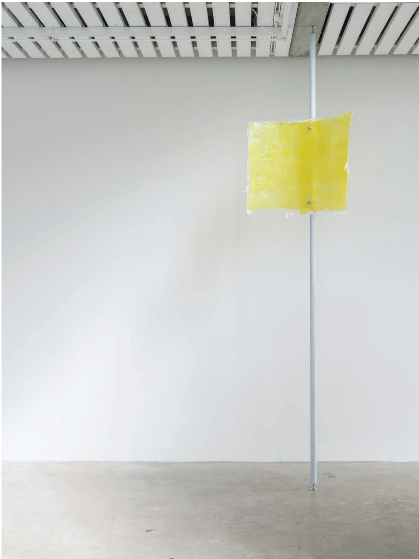
Mirroring , Cecilie Skov, 2021, epoxy, steel, silicone, yellow poppy. Duo show curated by Mai Dengsøe, Four Boxes - Skive, DK.