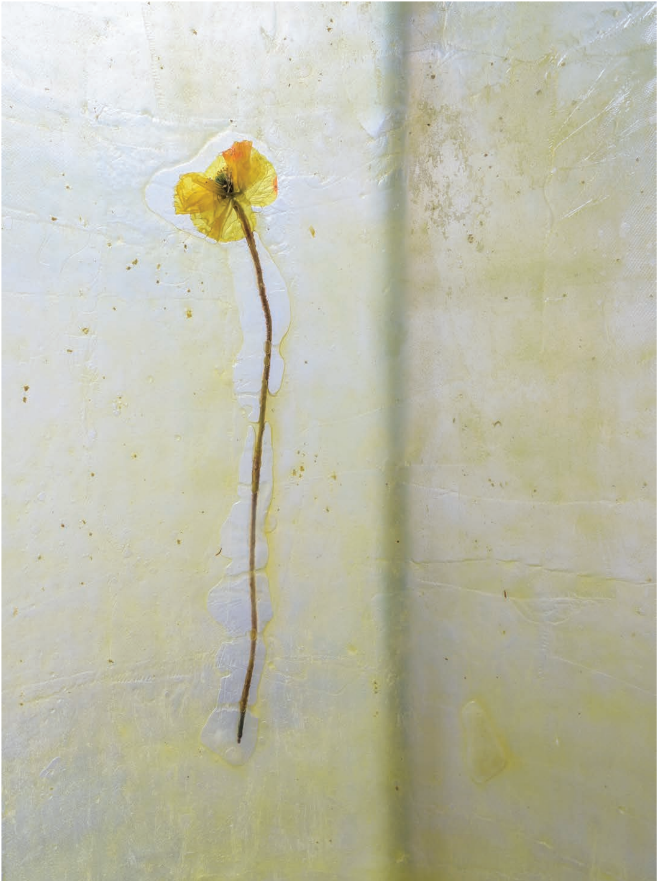
Mirroring , Cecilie Skov, 2021, epoxy, steel, silicone, yellow poppy. Duo show curated by Mai Dengsøe, Four Boxes - Skive, DK.