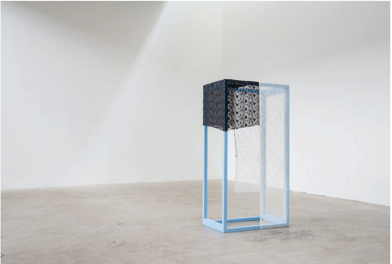
To feel the lack of something, that should have been yours , Aia Sofia Coverley Turan, 2021, wood, scarf and curtain. Duo show curated by Mai Dengsøe, Four Boxes - Skive, DK.