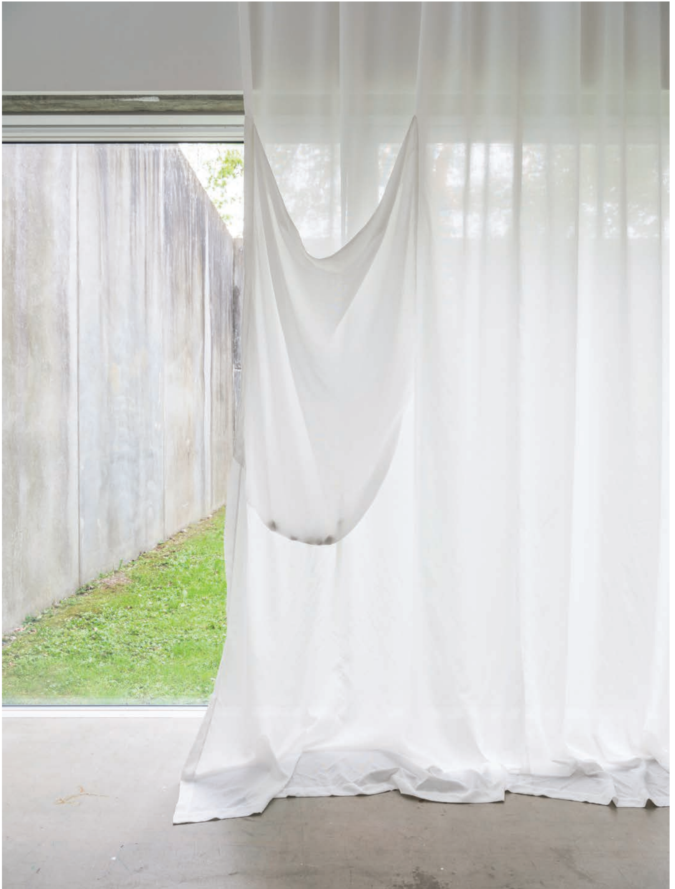
Five stone game , Aia Sofia Coverley Turan, Textile, steel, 5 stones, 2021, 450 x 245 cm. Duo show curated by Mai Dengsøe, Four Boxes - Skive, DK.