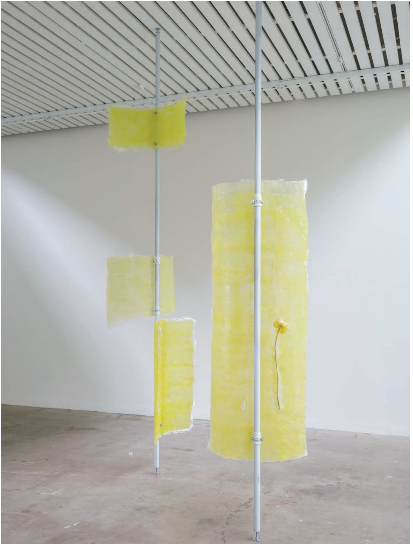
Mirroring , Cecilie Skov, 2021, epoxy, steel, silicone, yellow poppy. Duo show curated by Mai Dengsøe, Four Boxes - Skive, DK.