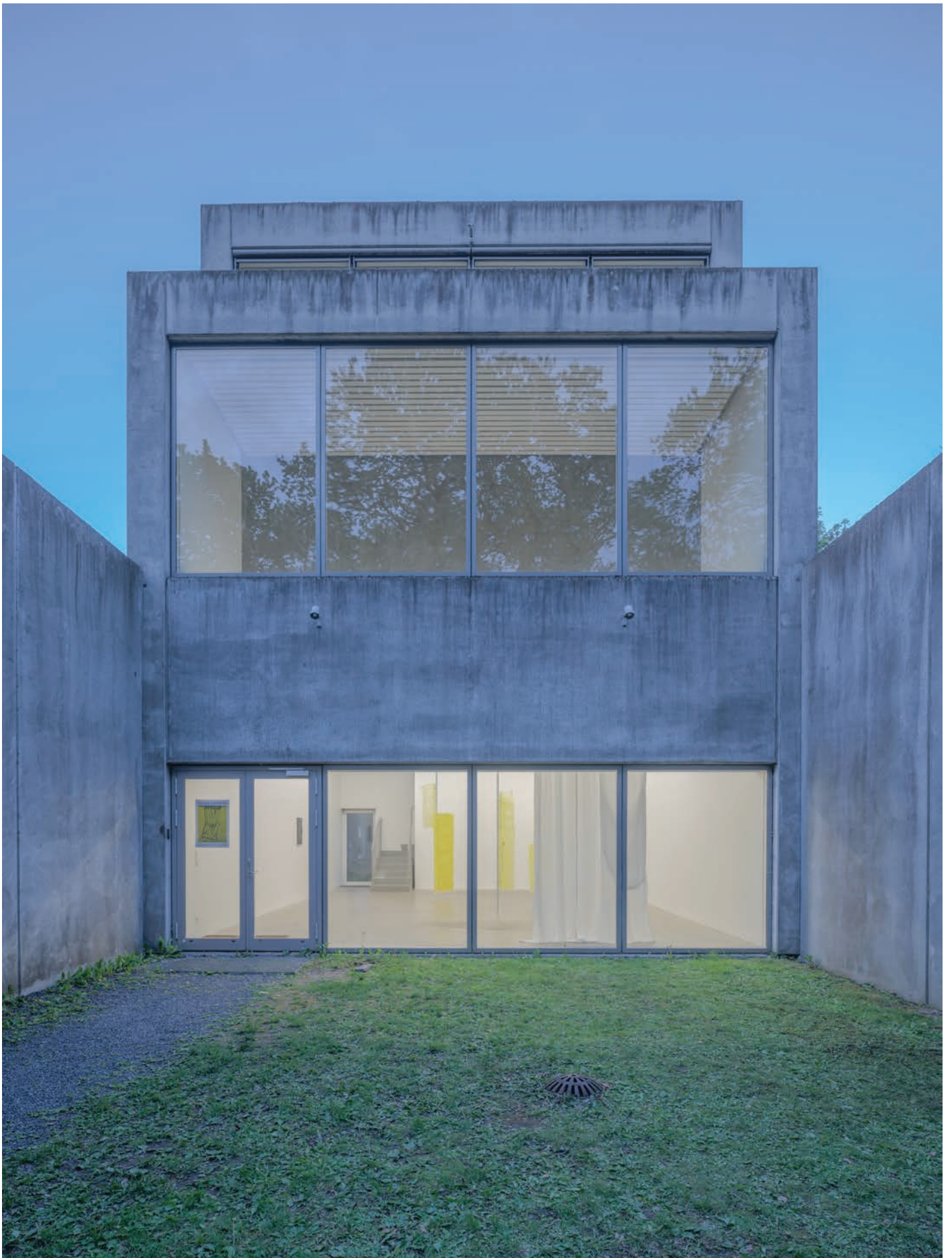
Four Boxes - Skive, DK.