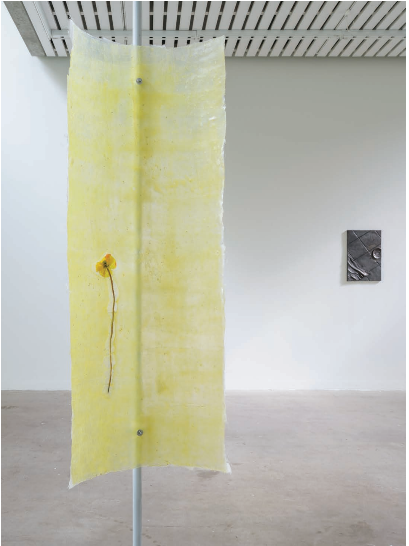
Installation view - Valmue Valentino , 2021, duo show with Cecilie Skov, Four Boxes - Skive, DK. Duo show curated by Mai Dengsøe, Four Boxes - Skive, DK.