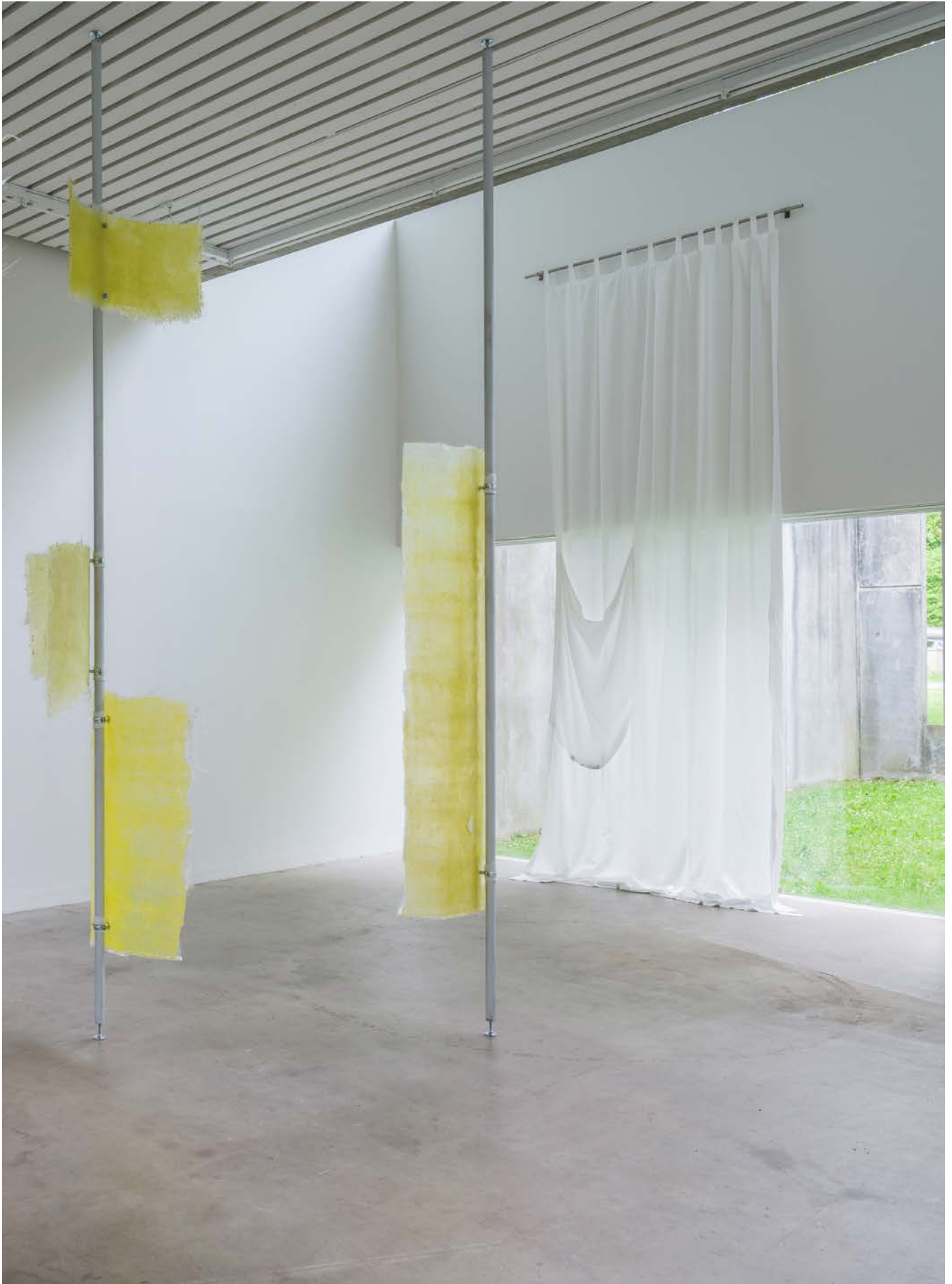
Installation view - Valmue Valentino , 2021, duo show with Cecilie Skov, Four Boxes - Skive, DK. Duo show curated by Mai Dengsøe, Four Boxes - Skive, DK.