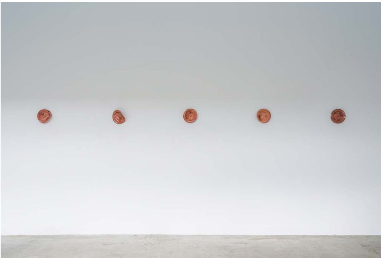
Manti , Aia Sofia Coverley Turan, 2021, terracotta, 15 cm (plate). Duo show curated by Mai Dengsøe, Four Boxes - Skive, DK.