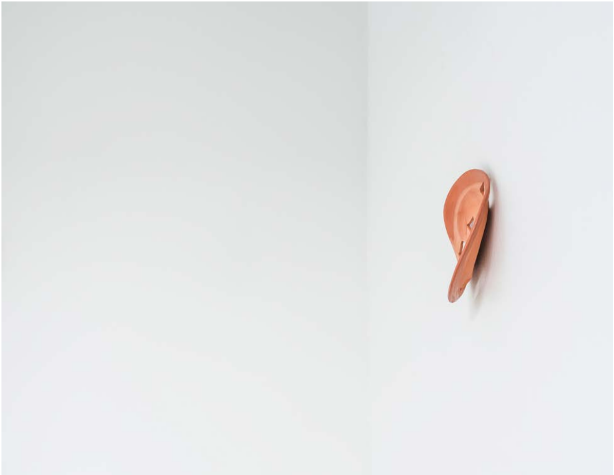
Detail, Manti , Aia Sofia Coverley Turan, 2021, terracotta, 15 cm (plate). Duo show curated by Mai Densgøe, Four Boxes - Skive, DK.