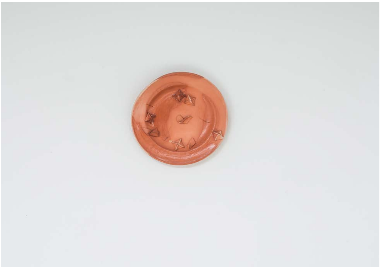
Detail, Manti , Aia Sofia Coverley Turan, 2021, terracotta, 15 cm (plate). Duo show curated by Mai Densgøe, Four Boxes - Skive, DK.