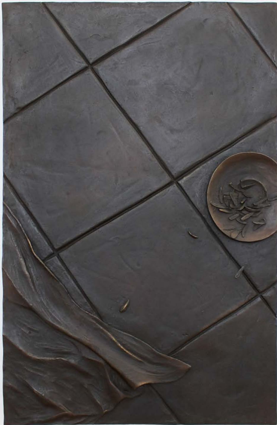
A handful of salt , Aia Sofia Coverley Turan, bronze, 2021, 60 x 40 cm. Duo show curated by Mai Dengsøe, Four Boxes - Skive, DK.