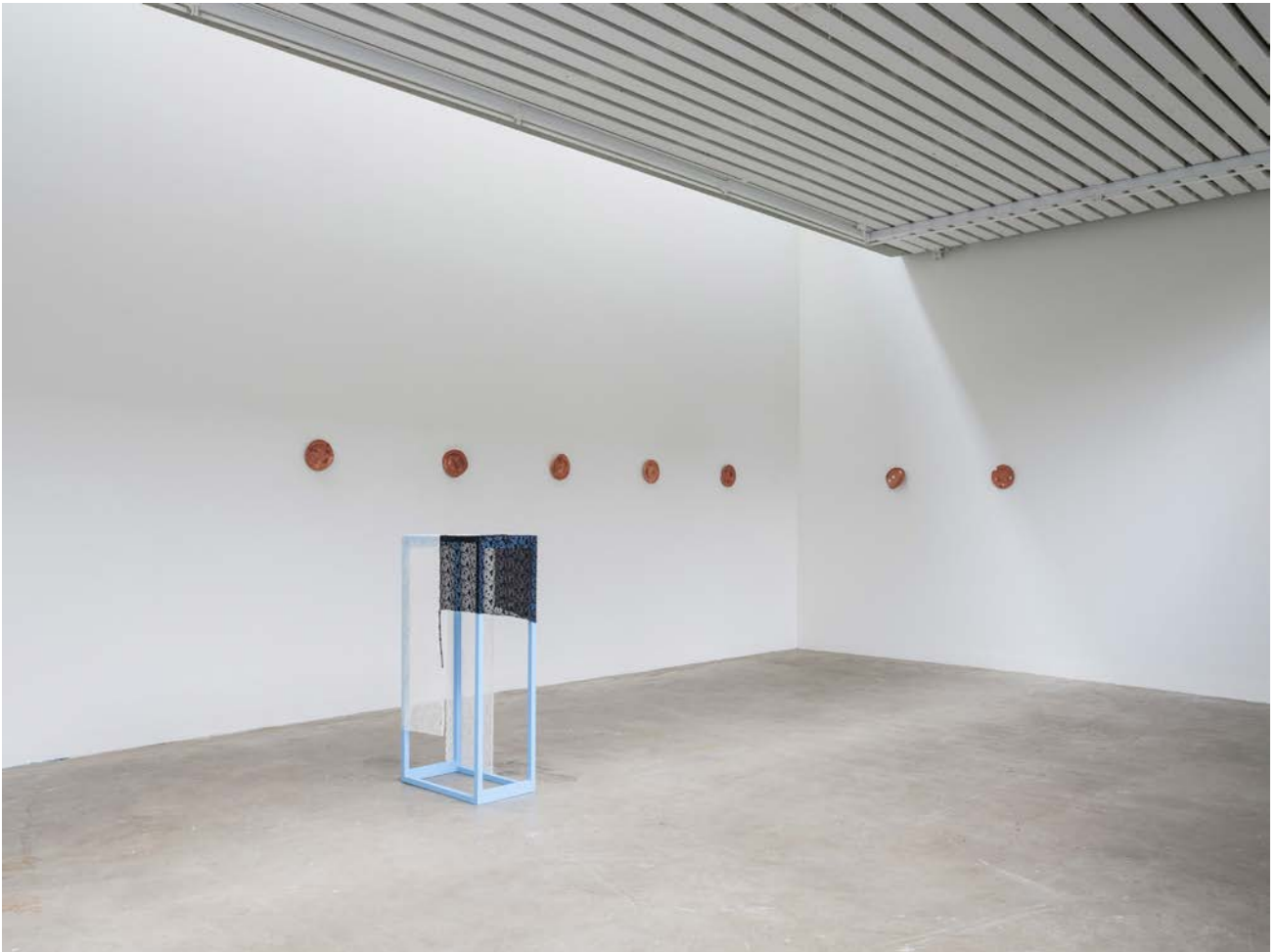
Installation view - Valmue Valentino , 2021, duo show with Cecilie Skov, Four Boxes - Skive, DK. Duo show curated by Mai Dengsøe, Four Boxes - Skive, DK.