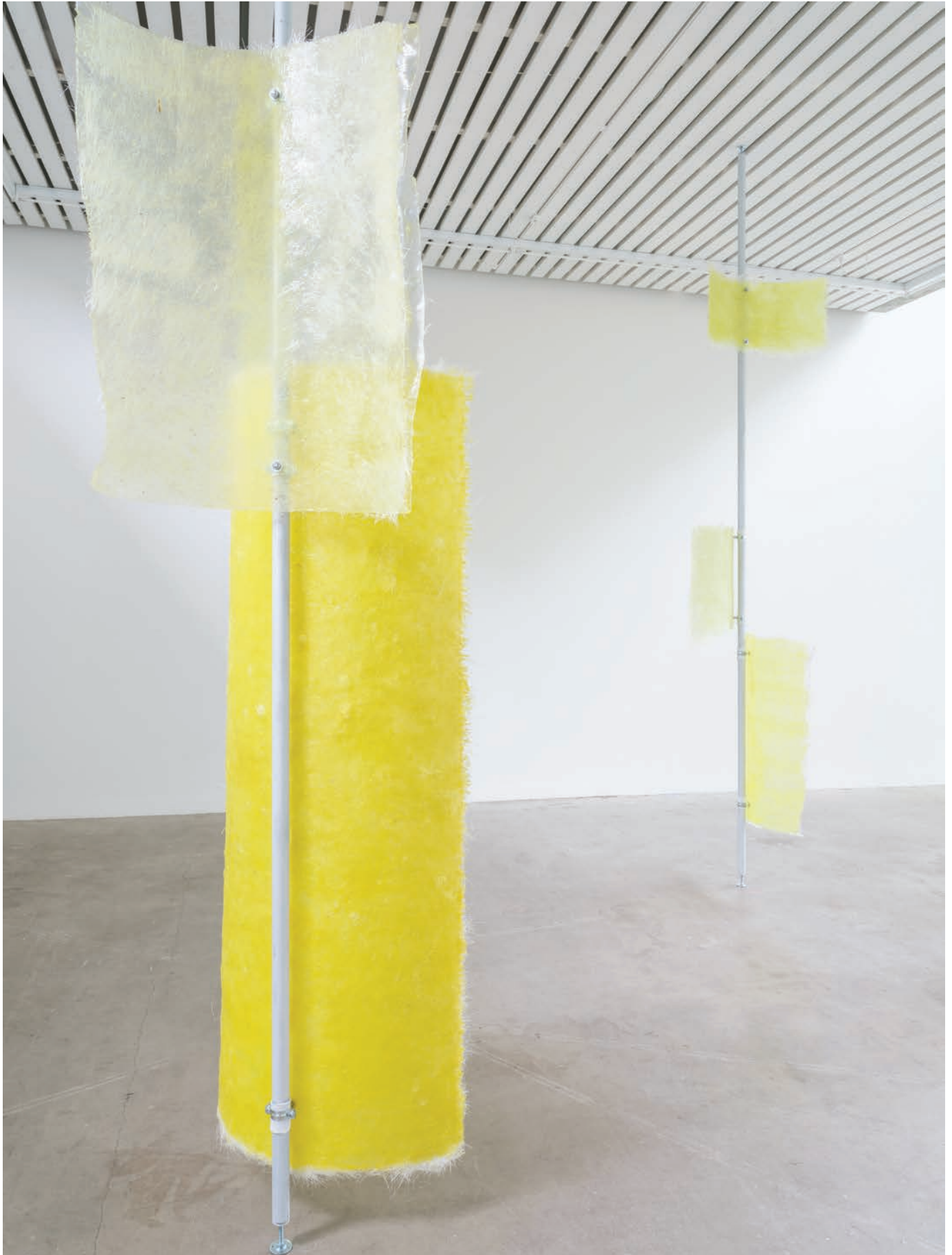
Mirroring , Cecilie Skov, 2021, epoxy, steel, silicone, yellow poppy. Duo show curated by Mai Dengsøe, Four Boxes - Skive, DK.